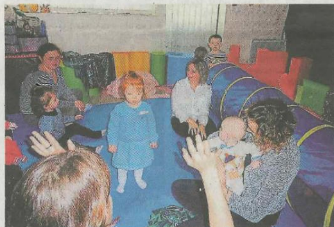
Dans le cadre de Croq'les mots Marmots, la compagnie Mixage fou était lundi au centre intercommunal d'action sociale pour y animer trois séances consécutives à l'éveil au numérique des jeunes enfants. Cette animation était destinée aux Pichou'n's de l'Escapade du Cias, à la Halte-garderie, au Relais d'assistantes maternelles, à la maison des assistantes maternelles, et aux mamans. Éveil des sons, du toucher avec des lumières, parcours avec une chenille sonore dans un tunnel, les tout-petits se sont facilement laissés prendre au jeu.