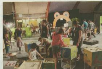
Pour suivre les petits dans toutes leurs aventures, mieux vaut venir à plusieurs adultes.

5 - Lire les ouvrages en amont. Douze auteurs-illustrateurs seront présents sur le salon pour échan-