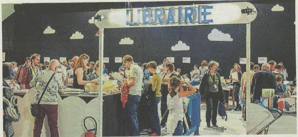
La cinquième édition de Croq'les mots, marmot ! se poursuit ce dimanche au parc des expositions de Mayenne.

Enfin, les spectacles, la seule partie payante de cette cinquième édition de Croq'les mots, marmot ! ont attiré de nombreux visiteurs. À chaque fois,