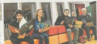
Journal dédié aux professionnels de la petite enfance, vendredi 12 mai.