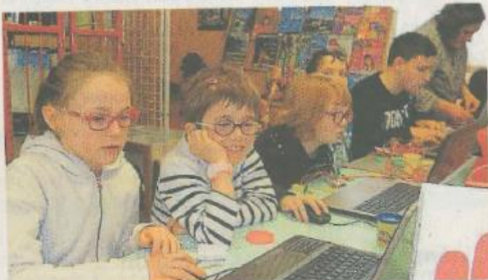
Les enfants se sont vraiment piqués au jeu avec le scratch MaKey MaKey.

Au Coding goûter, les enfants ont créé leurs histoires