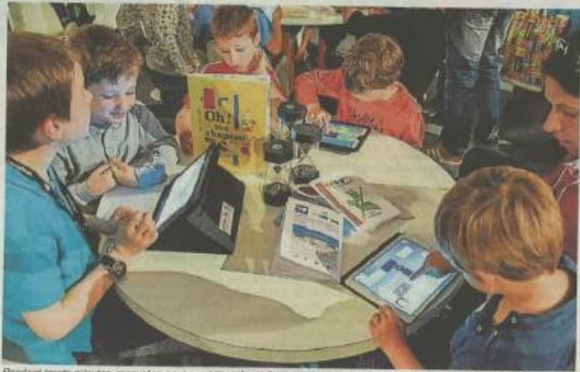
Pendant trente minutes, surveillées par les sabliers, les enfants pouvaient tester des applications sur les tablettes.

Une application a particulièrement fasciné les petits : ils pouvaient créer leur personnage qui apparaissait ensuite en 3D pour qu'ils jouent avec.