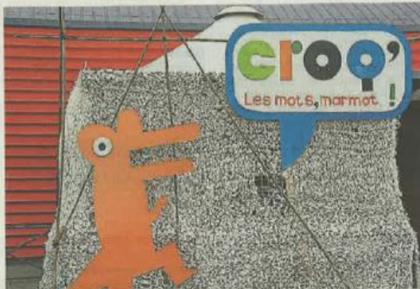
Le salon Croq' les mots, marmot ! revient pour une cinquième édition.

Cette année, les organisateurs ont décidé de mettre l'accent sur le numérique : une application inédite sera dévoilée, des ateliers (jardin d'été numérique, tapis enchanté, e-circus) sont prévus et des contes interactifs seront présentés par des bibliothécaires. « L'objectif de l'événement, c'est aussi d'inciter les parents à continuer la lecture, pour