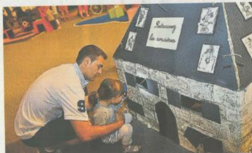
Comme en 2015, des activités pour les tout-petits et leur famille seront proposées durant le salon du livre, qui aura lieu à Mayenne, les 13 et 14 mai. La précédente édition avait attiré près de 3 500 visiteurs.