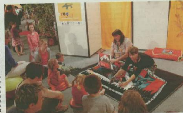
Des séances raconte-tapis sont proposées pendant le salon.