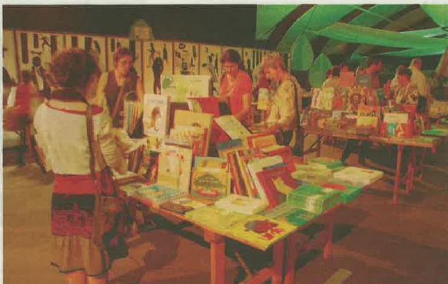
Une librairie géante sera accessible pendant tout le week-end.