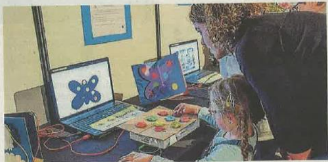
Cette cinquième édition est axée sur le numérique : les petits peuvent tester une animation inventée par d'autres enfants, habitant la Haute-Mayenne.

Ce dimanche , de 10 h à 18 h, au parc des expositions de Mayenne. Entrée gratuite (seuls les spectacles sont payants).