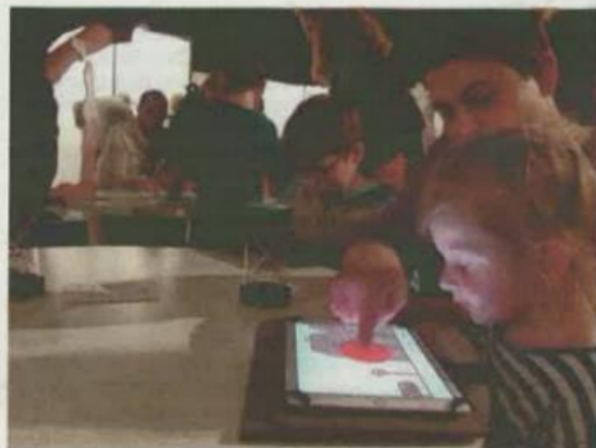
Petits et grands se sont amusés à découvrir des objets ou des personnages animés derrière les dessins.

« Comme ça, on fait un peu de tablette et un peu de livre », répond, satisfaite, sa maman. Beaucoup de parents ont été séduits par le concept d'une application complémentaire au livre qui s'inscrit selon eux dans une vraie démarche qui