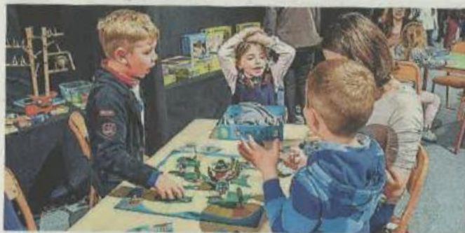
Des jeux de société sont à disposition des visiteurs.