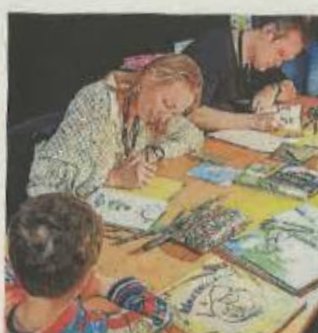
Dans l'espace librairie, les douze auteurs invités dédicacent leurs œuvres.