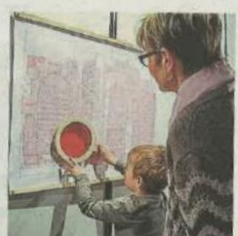
Grâce à la loupe, les enfants peuvent comprendre l'exposition.