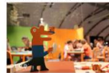
© Croq' les mots marmot 2016

professionnels et les parents... sur tout le territoire du Nord Mayenne.