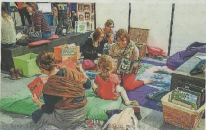
Un coin lecture permet de se poser en famille.