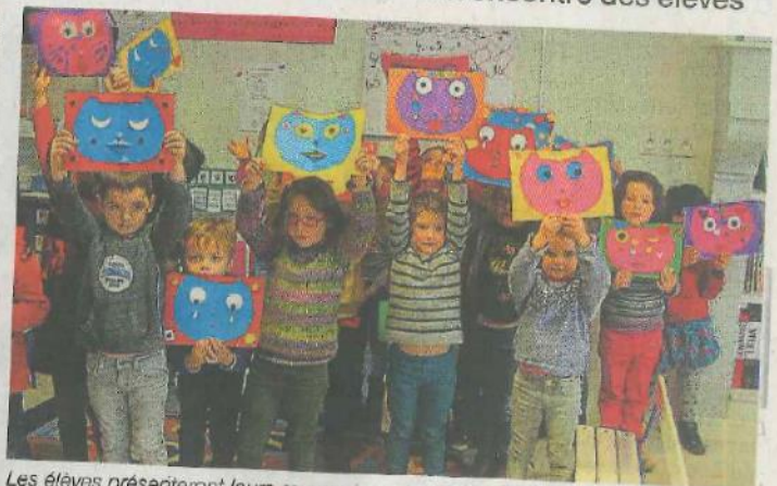
Les élèves présenteront leurs œuvres au salon du livre en mai.

L'auteure Annette Tamarkin à la rencontre des élèves